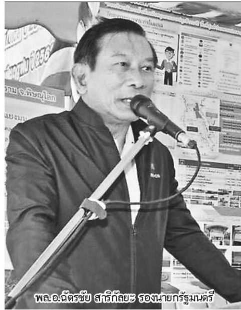
พล.อ.ฉัตรชัย สาริกัลยะ รองนายกรัฐมนตรี