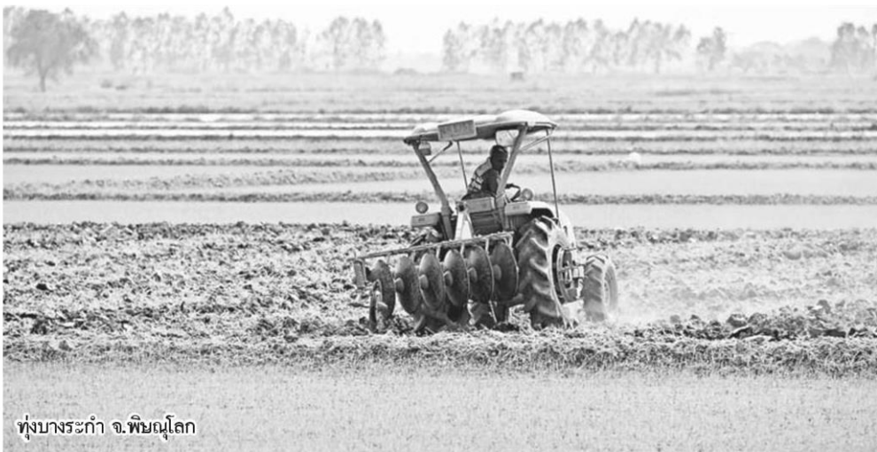
ทุ่งบางระกำ จ.พิจิตร โขงเจ็ญ

“บางระกำโมเดลยังจะช่วยส่งเสริมให้เกษตรกรมีรายได้เสริมจากการทำอาชีพประมง ซึ่งเป็นวิถีชีวิตของเกษตรกรในพื้นที่ลุ่มต่ำ และการปล่อยน้ำให้ท่วมนาในช่วงนี้ จะทำให้พื้นที่ดังกล่าวมีอาหารปลาที่สมบูรณ์ เพราะเมล็ดข้าวที่ร่วงหล่น หรือเกิดขึ้นมาใหม่ จะเป็นอาหารของปลาอย่างดี ปลาจะชุกชุมมากเป็นพิเศษ รายได้เสริมจากอาชีพประมงให้แก่เกษตรกร รวมทั้งน้ำที่เก็บกักไว้ยังสามารถนำมาบริหารจัดการใช้เป็นน้ำต้นทุนในการทำนาปรัง และการอุปโภคบริโภค ทั้งในเขตโครงการและลุ่มน้ำเจ้าพระยาตอนล่างอีกด้วย”